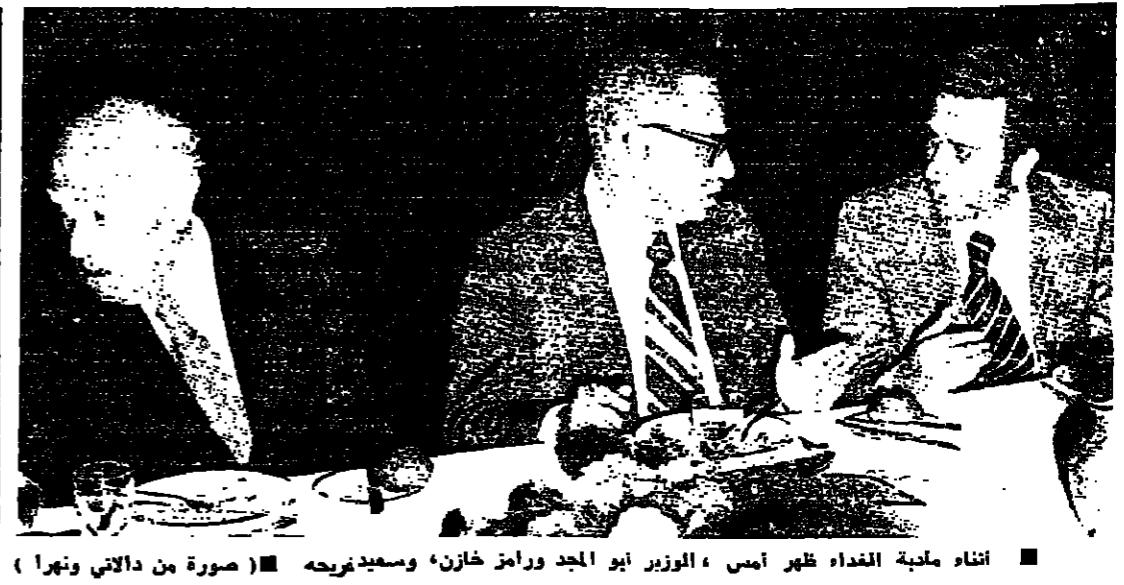
اتحاد ملعبة الغذاء ظهر أمس ، والوزير أبو الجرد ورامز خان، ومديره